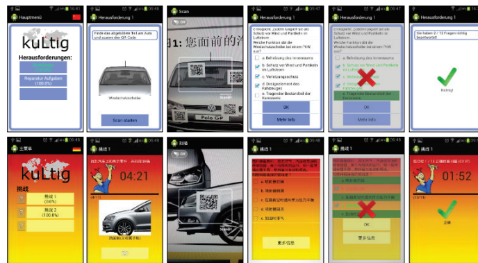
Abbildung 2: Oben: Basis Lernanwendung; unten: kulturell angepasste Lernanwendung für China

Im folgenden Abschnitt werden Gestaltungselemente (D1-5) unter Beachtung der formulierten Anforderungen (A1-5) hergeleitet. Abbildung 2 zeigt die prototypische Implementierung.