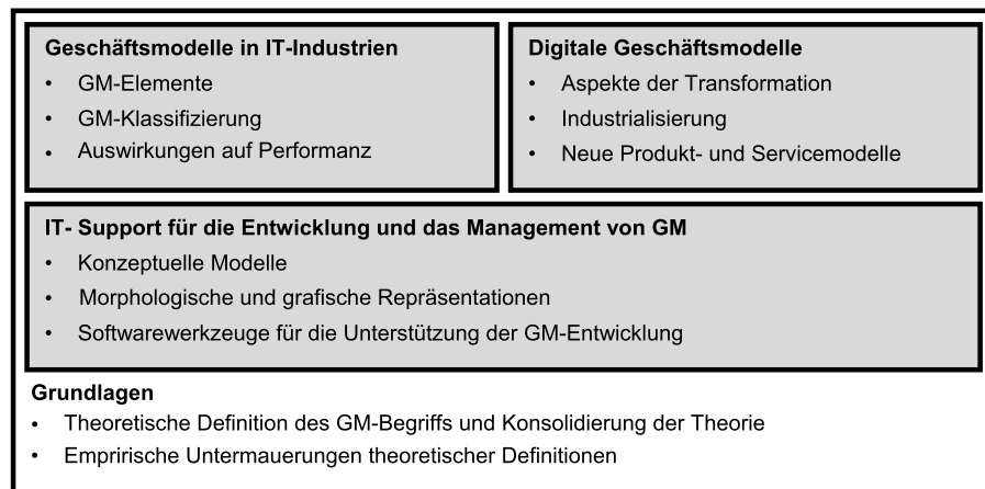
Abb. 2 Erwartete Forschungsergebnisse und Zielsetzungen

einer der ersten Autoren, der elf Arten von E-Commerce-Geschäftsmodellen herleitet. Neben den Forschungsarbeiten zu den Grundlagen des Geschäftsmodellkonzepts existieren in der Literatur darüber hinaus einige Artikel, die sich mit der Innovation von Geschäftsmodellen sowie Aspekten hinsichtlich ihrer Performanz befassen. So zeigt bspw. ein Artikel zur Geschäftsmodellinnovation, wie das Unternehmen Xerox Wert durch Innovationen generiert, indem das Unternehmen sein Geschäftsmodell an äußere Einflüsse angepasst hat (Chesbrough und Rosenbloom 2002). Erste quantitative Artikel zur Performanz von Geschäftsmodellen betrachten deren Konfiguration (Zott und Amit 2007, 2008) und finden Implikationen, die weit über das hinausgehen, was anhand der Unternehmensstrategie beschrieben werden kann.