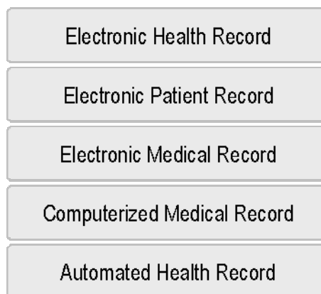
Abbildung 2: Zunehmende Informationsintegration und Patientenzentrierung

Mit der genannten Berücksichtigung der Informationsintegration und der Patientenzentrierung wird die bei Waagemann (1999) beschriebene zunehmende Integration und Orientierung am Patienten (vgl. Abbildung 2) erfüllt. Dabei werden oftmals mehrere Stufen der Digitalisierung durchlaufen: