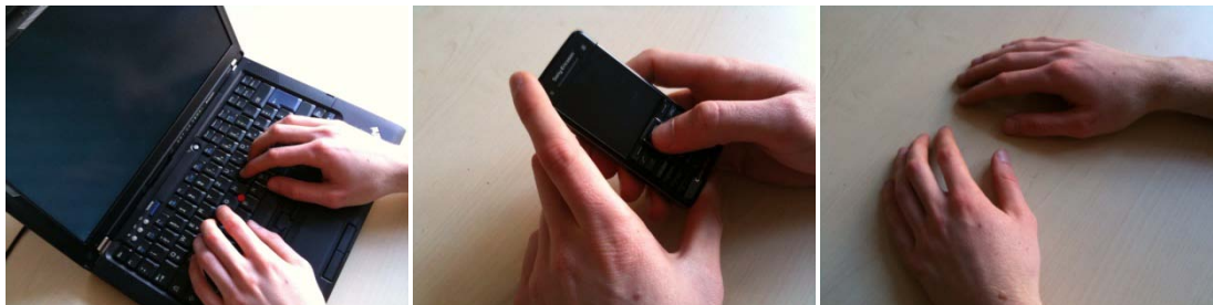
Abbildung 1: Personal Computing – Mobile Computing – Ubiquitous Computing

Ein Problem im Zusammenhang mit Ubiquitous Computing ist gerade die Neuartigkeit der Systeme. Die Vision von Weiser ist sehr abstrakt [1]. Konkrete Beispiele beschränken sich auf Umsetzung in Forschungseinrichtungen. Der breiten Öffentlichkeit sind der Begriff und das dahinterliegende Paradigma kaum bekannt. Wird der Nutzer an der Entwicklung beteiligt oder in die Mitte der Anforderungserhebung gestellt, steht er vor der Herausforderung, gleichzeitig die Systeme zu begreifen, ihre Regeln zu verstehen und innerhalb dieser Regeln Anforderungen für ein neues System zu sammeln. Er ist also durch die Neuartigkeit überfordert [11].